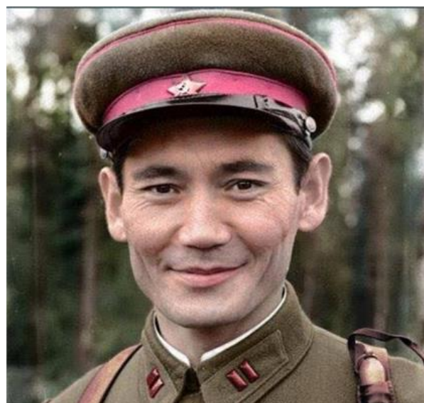
Бауыржан Момышулы родился 24 декабря 1910 г. Уроженец Жамбылской области, казахский писатель, Герой Советского Союза (1990) посмертно