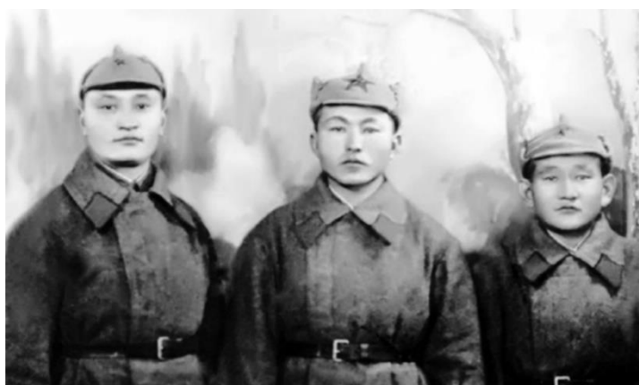
Фото: Казахстанцы 333-го стрелкового полка

Защитники БРЕСТСКОЙ КРЕПОСТИ, а в их числе и наши казахстанцы, встретили врага огнем и штыками. Ее