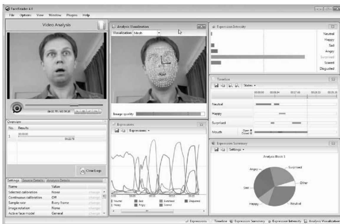
Рисунок. – Интерфейс программы FaceReader 4.0

Используя различные программные продукты и современные технологии, становится возможным автоматическое считывание поведенческих реакций человека при осуществлении пропуска физических лиц через Государственную границу. В качестве примера можно привести программу FaceReader (рисунок) [1].